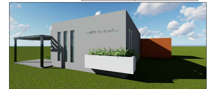
Perspectiva ilustrativa Sem escala