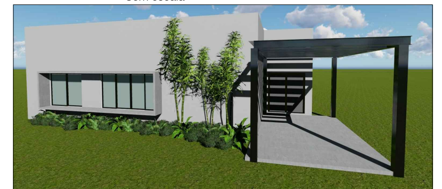
Perspectiva ilustrativa Sem escala

OBS: as perspectivas são meramente ilustrativas para visualização da composição de cores dos volumes.